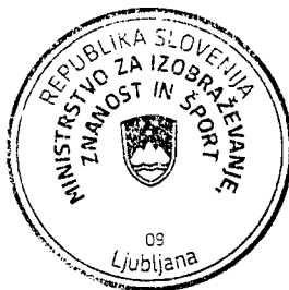
dr. Jernej Pikalo minister