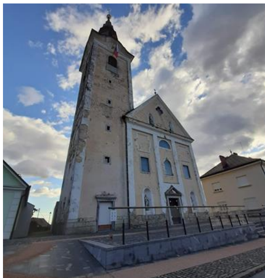
Cerkev Sv. Štefana, 4. 2. 2021, Semič